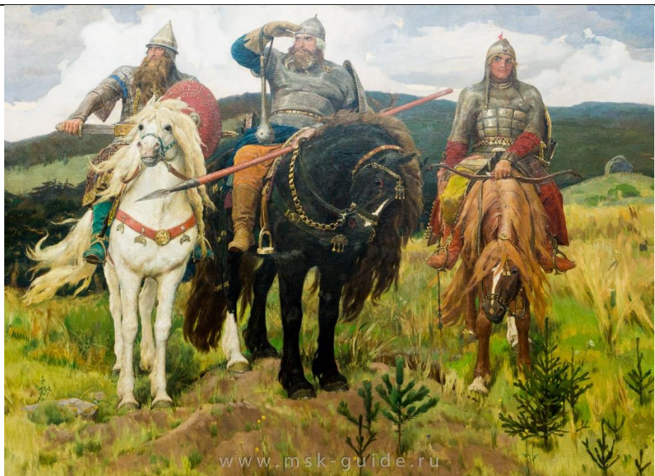
илл. № 2